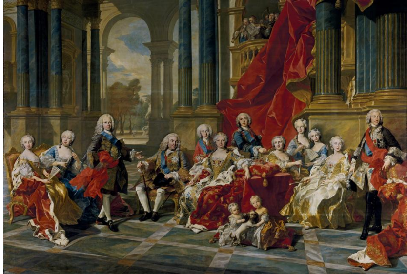
8. Louis Michel van Loo. Philippo V e Elisabetta Farnese nel 1743. Madrid, Museo del Prado.